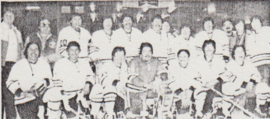
CLASSE "OLD TIMERS" . Cinq équipes se disputaient les honneurs dans la catégorie "Old Timers". C'est finalement la formation de Chisasibi qui a défilé, en finale, Waswanipi par la marque de 6 à 0. Auparavant, Waswanipi avait vaincu Chisasibi (5-3) et Chisasibi avait triomphé de Ruppert House (6-1).