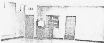
Une vue intéressante de la nouvelle salle communautaire.