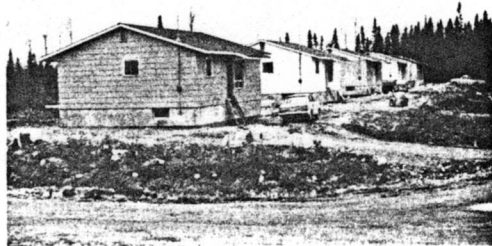
Sur cette photo, une rue de maisons construite par le Fédéral pour les Indiens du lac Simon.

Dans la nouvelle section, des rues ont été aménagées. Elles seront grave-