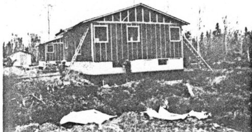
Une maison avec soilage, sous-sol, bien isolée, quelle différence d'avec la tente ou la vieille bicoque que les Indiens habitaient autrefois.

Sans compter qu'une importante installation électrique est mise en place dès à présent.