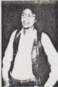
Les Algonquins de l'Ouest du Québec tiendront une conférence le 3 juin.

Algonquins de Québec tiennent grande assemblée du 3 au 6 juin, dans le but de créer une structure représentative et confier le mandat d'entreprendre des liens avec les habitants pour obtenir reconnaissance de leur peuple et comme tout un peuple.