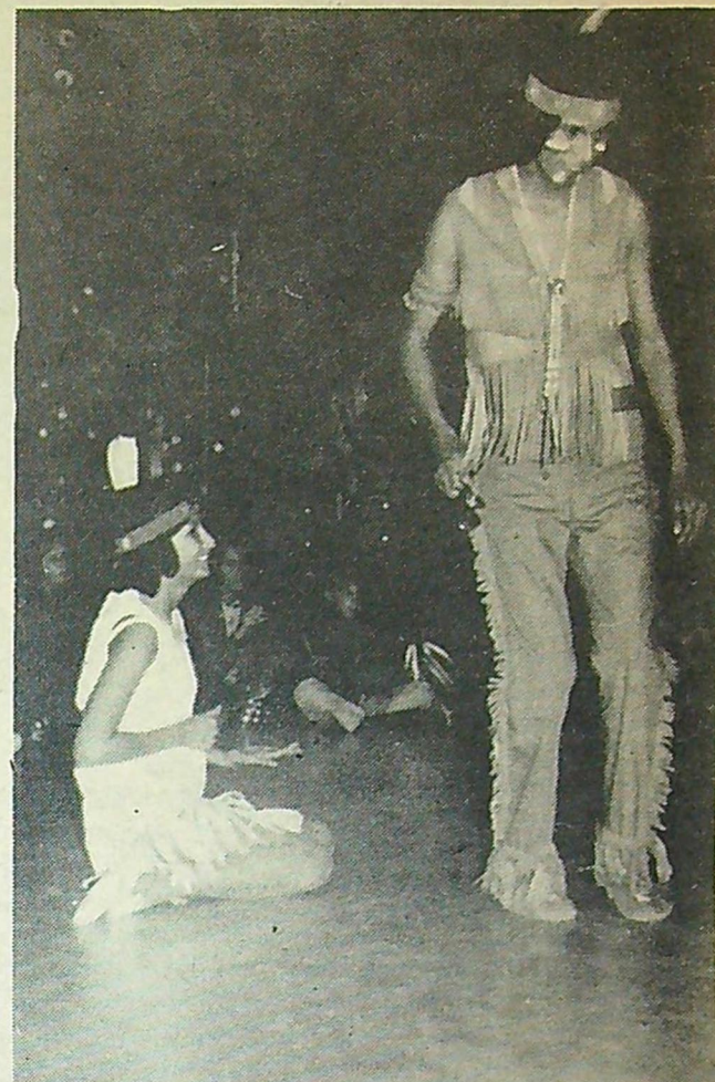
Les Indiens du village Pikogan donneront, en costumes traditionnels, un spectacle de danses propres aux célébrations de Pow Wow, samedi le 22 juillet à 20h. au village Pikogan. Le village Pikogan est situé à deux milles de la ville d'Amos sur la route 61 nord. Le spectacle s'inscrit parmi les nombreuses activités qui se dérouleront au village Pikogan à l'occasion de grand Pow Wow du district Abitibi, les 21, 22 et 23 juillet prochains.

chémun Baie Carrière, à cinq milles de Val d'Or. Un guide est toujours présent du mercredi au dimanche inclusivement. Si vous voulez faire des excursions, si vous avez un problème d'écologie, communiquez avec Projet écologique, 824-9372.