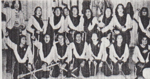
L'équipe de Pikogan a remporté le tournoi de ballon-sur-glace grâce à une victoire de 1 à 0 lors de la finale contre l'équipe du Lac Simon.

(M.L.) L'équipe de hockey des Mohawks de Caughnawaga a remporté la 3e édition du Tournoi annuel amérindien qui se tenait en fin de semaine dernière au Palais des sports de Val d'Or. Cette équipe de la région de Montréal a triomphé en finale de la formation de Rapid Lake par la marque de 10 à 4. Ce tournoi en était à sa troisième édition mais c'était la première fois que la Fondation québécoise des Cris de la Baie James assumait l'organisation entière de la fin de semaine. Les profits, d'ailleurs, de ce tournoi seront versés à la Fondation qui elle s'occupe de l'enfance cri sur le territoire de la Baie James. C'est incidemment le 24 février