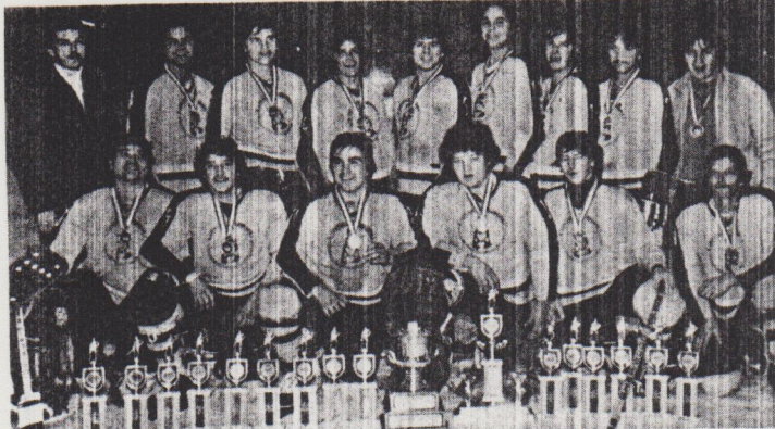
La formation des Mohawks de Caughnawaga ont facilement disposé, en finale de Grand Championnat, de l'équipe de Rapid Lake par la marque de 10 à 4. Cette formation s'est ainsi méritée le trophée annuel de la Fondation des Cris de la Baie James.