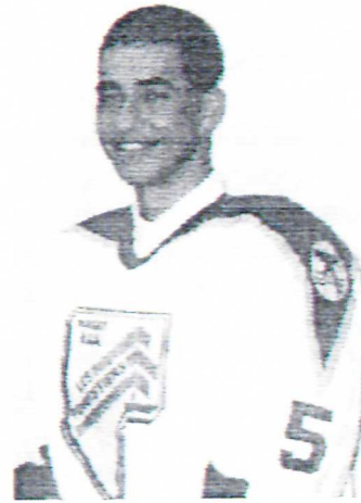
Statistique saison 1996-97